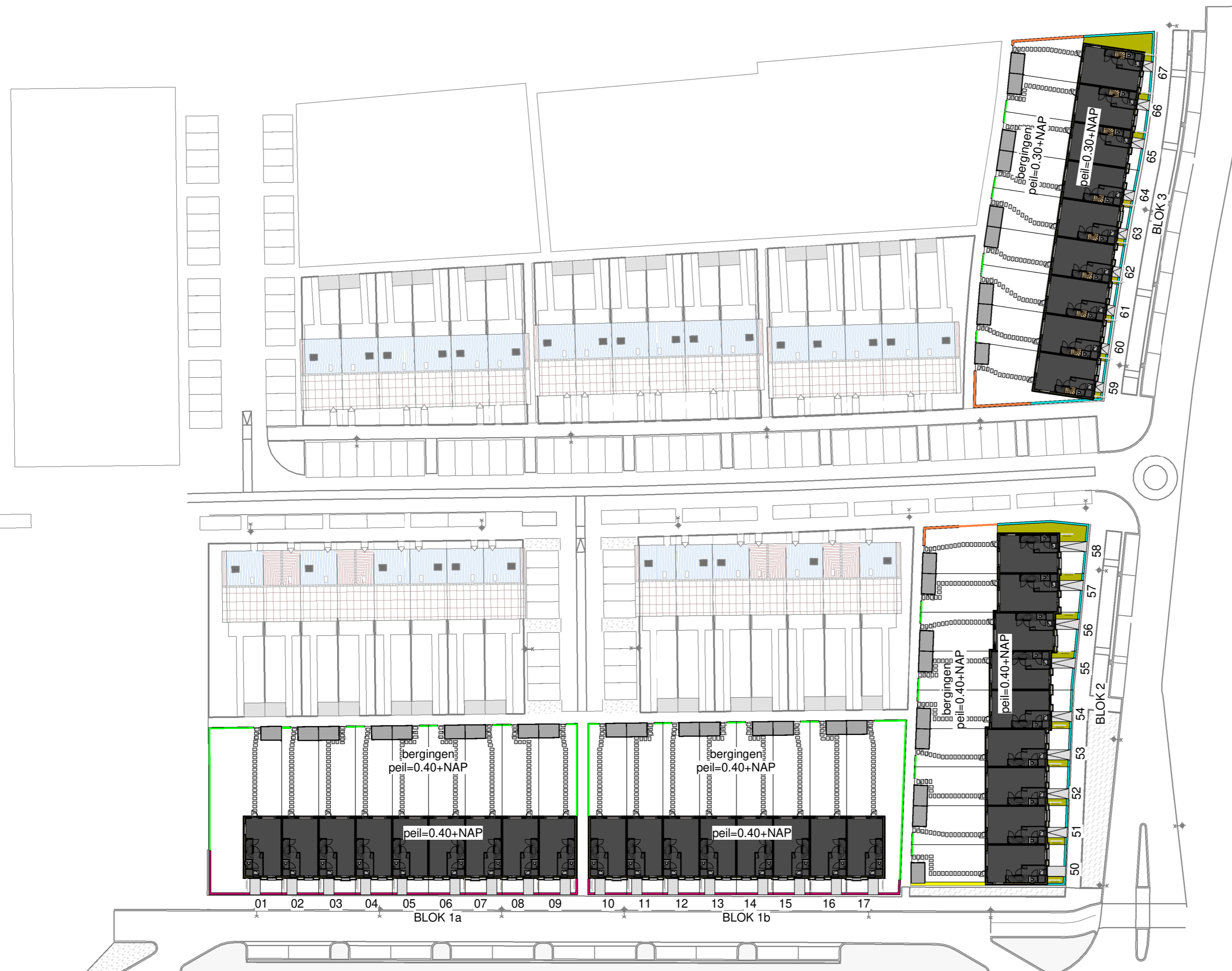
Laan van 't Haantje